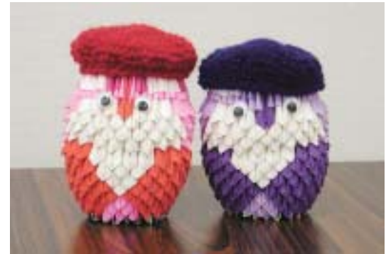
題名「仲良しフクロウ夫婦」