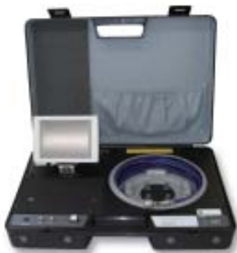
内視鏡テレビカメラ

事前に管内検査・内視鏡テレビカメラ（を実施することが最も重要で、付着の状況等を確認し洗浄計画に役立てます。また、洗浄後の管内検査を実施することで、洗浄後の実証が出来ます。