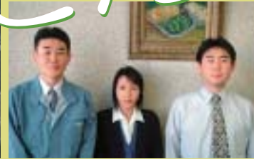
(左から)佐伯課長、鳥飼主任、上本係長 取材にご協力頂きありがとうございました。