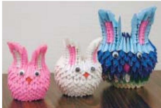
題名「三匹のウサギ」

私達が作った紙のお人形と花瓶達です。かわいくありませんか? 折り紙手芸は、小さな三角形のブロックをひとつひとつ積み上げて形にしていきます。小さなブロックですから想像力で無限の形に変化していきます。今回ご紹介しているのは私達が作成したその作品の一部です。完成したときの気持ちは感動に似たものです。皆さんも始められてみませんか?