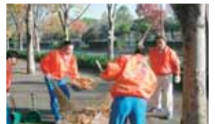
作業する國光社長(右)と貞兼取締役(左)