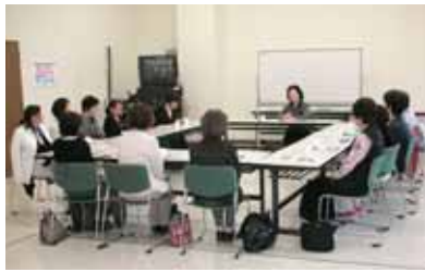
国広講師によるマナー研修

し、1月に防府地区、その他地域と順次行います。本年は、①仕事をする上でお客様にいい印象をもっていただくための基本的な言葉使いとマナーについて、②クレーム及び事故の発生事例とその対応・対策について、③基本的な資機材の使い方についての3つのテーマに研修を行っています。少しでも楽しく、有意義に仕事をしていただくために、我々も内容を考えて研修会を実施していきますので、参加された皆さんも、何かしらのヒントをつかんで実践に生かして下さい。