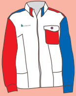
ジャンパー新デザイン