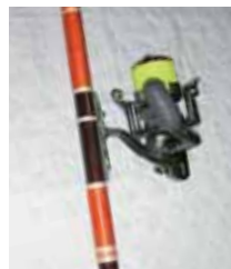
父親の形見のリール(シマノ製)