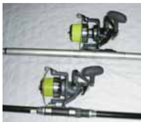
投げ釣り用(上:ダイワ製・下:シマノ製)