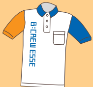
ポロシャツ新デザイン