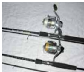
イカ・シーバス専用