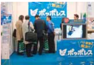
盛況だった「ポッポレス」展示ブース

全国ビルクリーニング技能競技大会は10回目の開催となり、全国から選抜された18名による競技会の他、過去の大会で入賞した選手によるグランドチャンピオン大会も大会初日に開催されました。また、7回目を迎える「ビル設備管理技能演技会」や各種分科会や特別セミナーの他、今回初めての開催となる「ベスト・インスペクター賞発表」や「アジアビルメンテナンス大会」も開催されました。ビルメンテナンス総合資機材展では、当社も前回に引き続きハト飛来防止用忌避財「ポッポレス」を出展し、3日間で約300名の来場をいただき、改めて関心の高さに驚かされました。