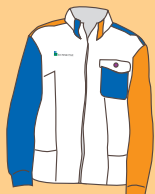
ジャンパー新デザイン