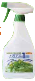
噴霧スプレータイプ (500ml)

ノロウィルスを対象として検証試験を行っ た結果、ノロウィルスの遺伝子を破壊し、 殺菌することが証明されました。