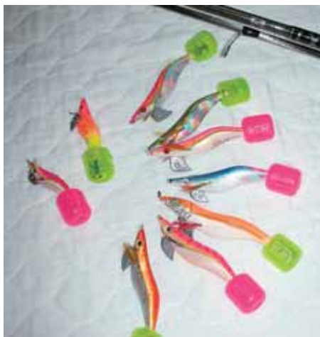
イカ釣り専用の餌擬(イギ)

仕事の疲れを癒すため、暇をみつけては海釣りに行っています。ストレス解消にはもってこいですが、成果がいまいちだと逆にストレスが倍増したりして・・・