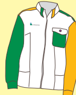
ジャンパー新デザイン