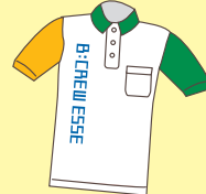
ポロシャツ新デザイン